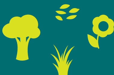
Plantes ou parties de plante