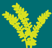
Thym vulgaire nord de la France